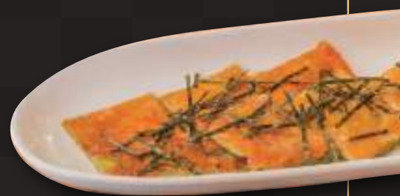
明太チーザチヂミ Sliced Korean pancake w/spicy cod roe and cheese