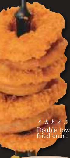
イカとオニオンのWリングタワー Double tower of deep fried onion and squid rings