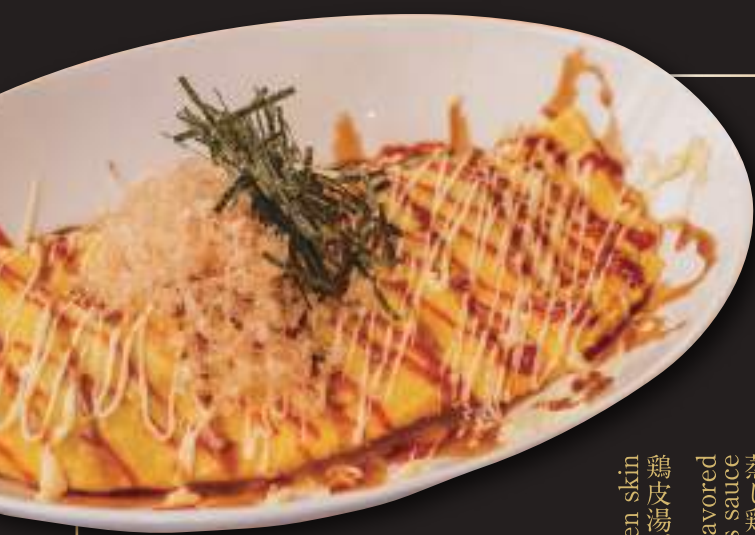
げんべのとんべい焼き Grilled cabbage and pork omelet