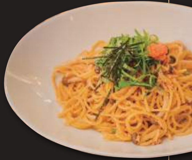
明太子とキノコの和風パスタ Japanese style pasta w/ spicy cod roe and mushrooms