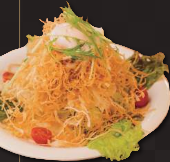
パリパリサラダの温玉のせ Salad topped w/crispy fried noodles & a poached egg (Caesar / Soy) Dressing