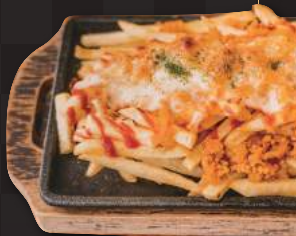
カリカリポテトのアメリカンチーズ焼き Crispy french fries baked w/minced meat and cheese