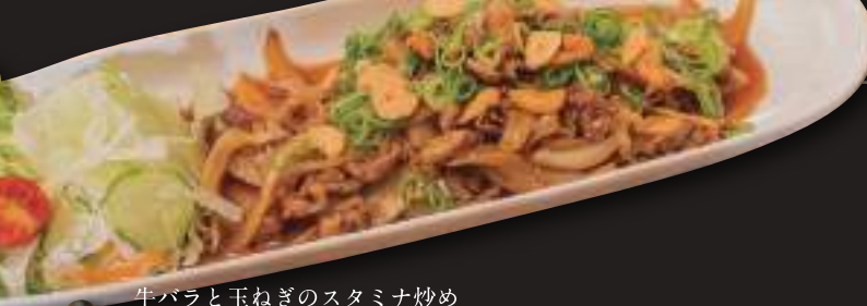
牛バラと玉ねぎのスタミナ炒め Boneless beef ribs and sliced onions with garlic