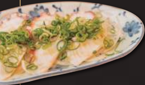
たこねぎゴマ油和え Octopus w/diced green onions dressed in sesame oil